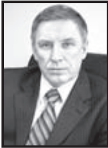
График приёма граждан руководителями ЗАТО г. Радужный