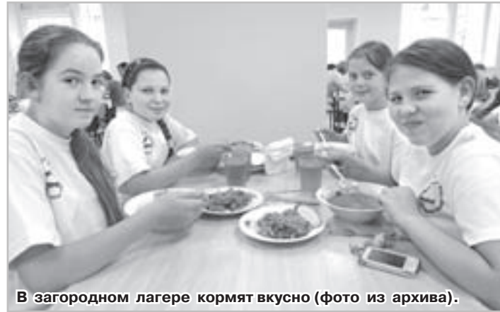
В загородном лагере кормят вкусно.