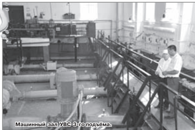
Машинный зал УВС 3-го подъёма.

Вопрос о качестве воды - это проблема не только нашего региона, а и всей страны. К сожалению, не все регионы могут похвастаться прекрасной водой, но в нашем городе вода не из худших.