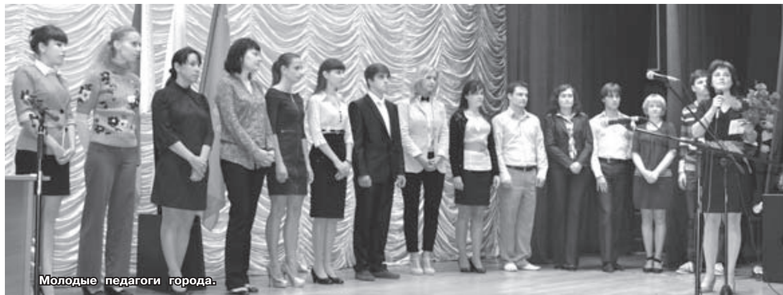
Молодые педагоги города.