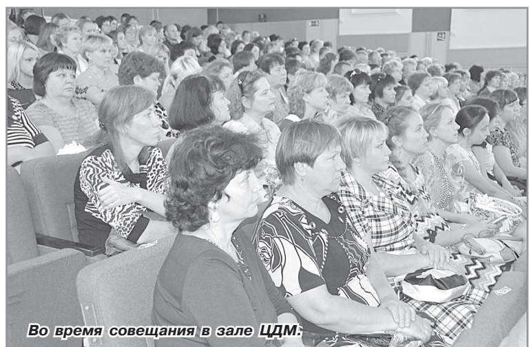
Во время совещания в зале ЦДМ.