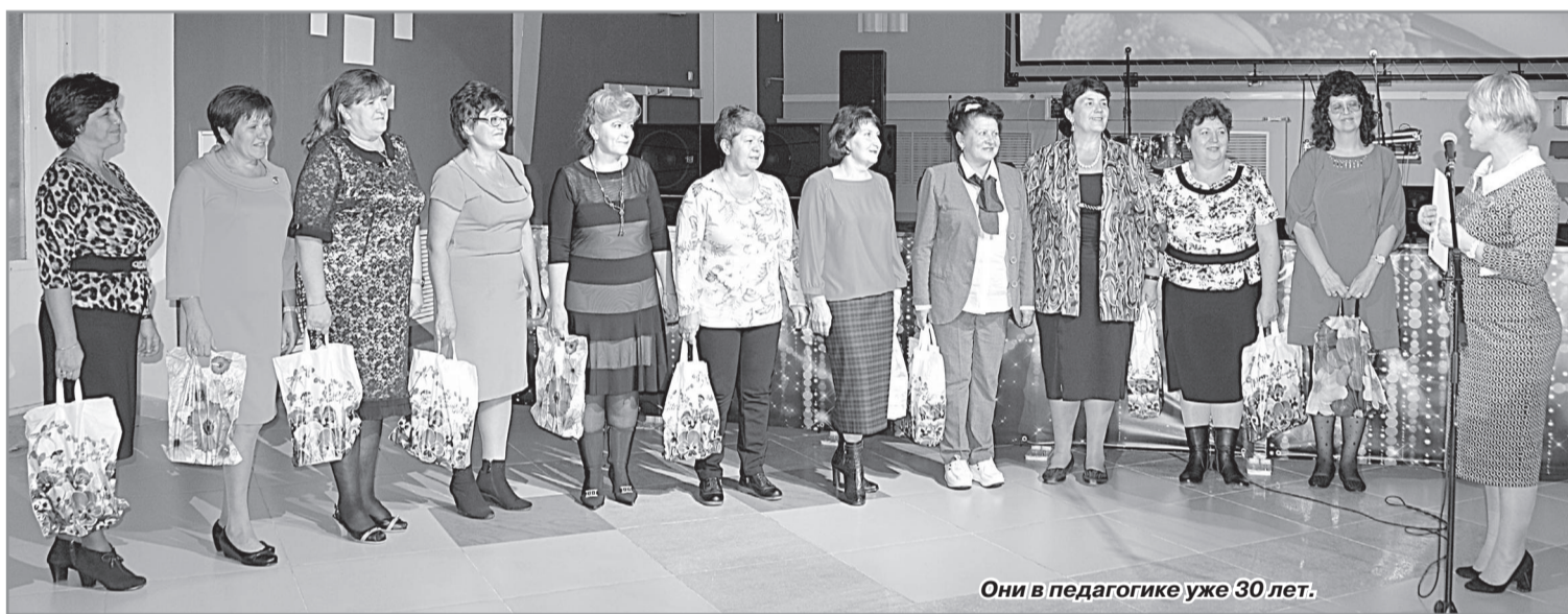
Они в педагогике уже 30 лет.