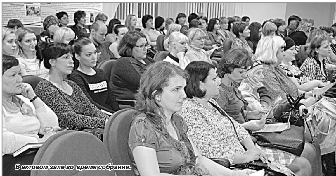
В актовом зале во время собрания.