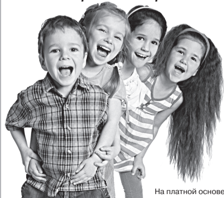
На платной основе.

Телефон для справок — 3-43-33. Управление образования.