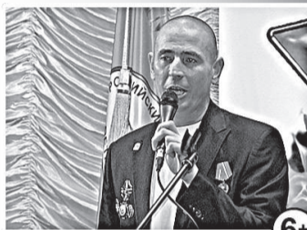
На платной основе.