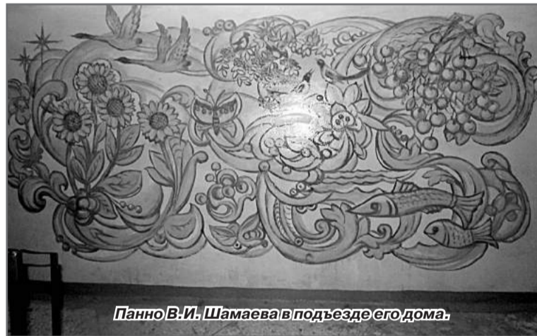
Панно В.И. Шамаева в подъезде его дома.

Другой подъезд, который завораживает взгляды, расположен в доме №33 1-го квартала (это подъезд №2). Здесь живёт из-