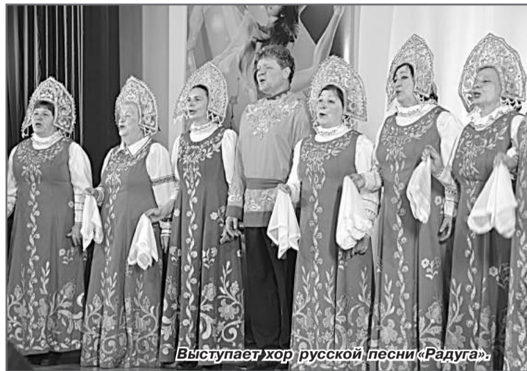
Выступает хор русской песни «Радуга».