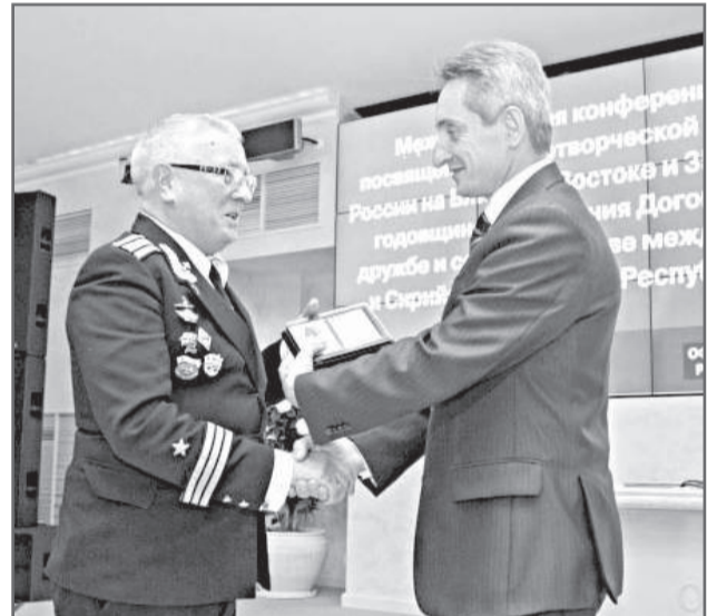
ную Думу РФ. Продвижением документа занимается депутат Государственной Думы Михаил Дегтярев.

К настоящему времени проект закона о признании ветеранов военной службы в Сирии с 1982 по 1986 год ветеранами боевых действий передан в Государствен-