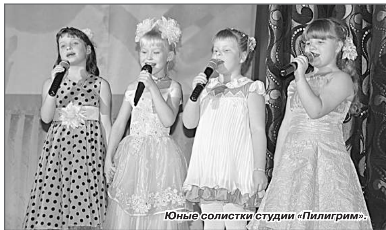
Юные солистки студии «Пилигрим».