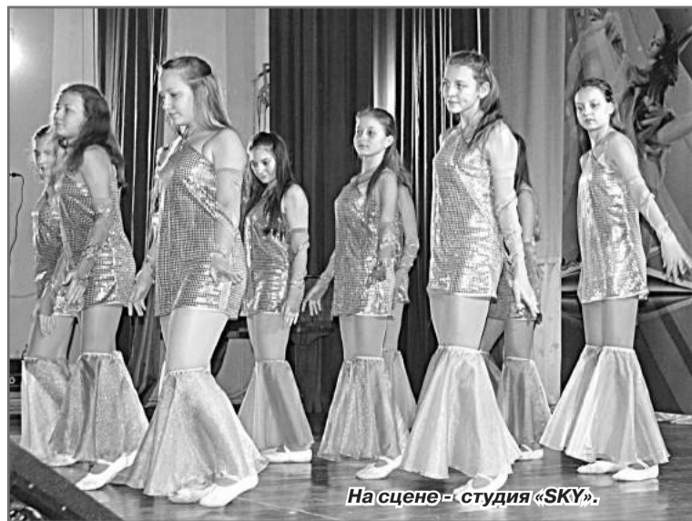
На сцене - студия «SKY».