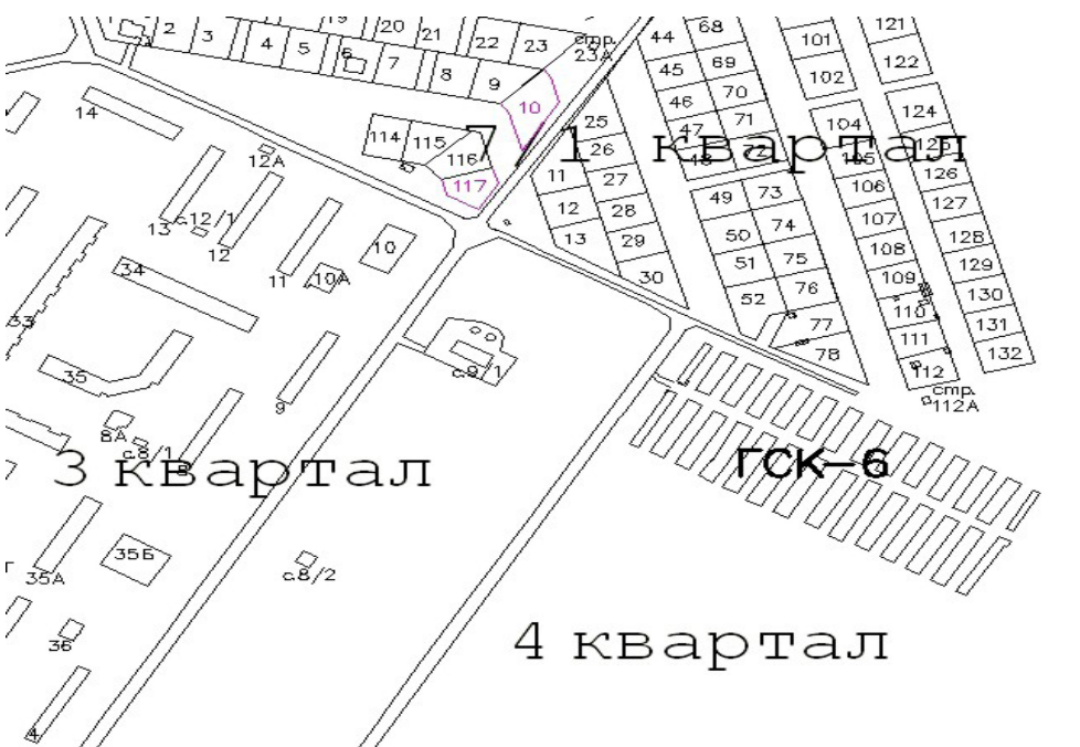
Выкопировка из Адресного плана ЗАТО г. Радужный

Приложение № 2 к постановлению администрации ЗАТО г. Радужный от 12.11.2015 № 1865