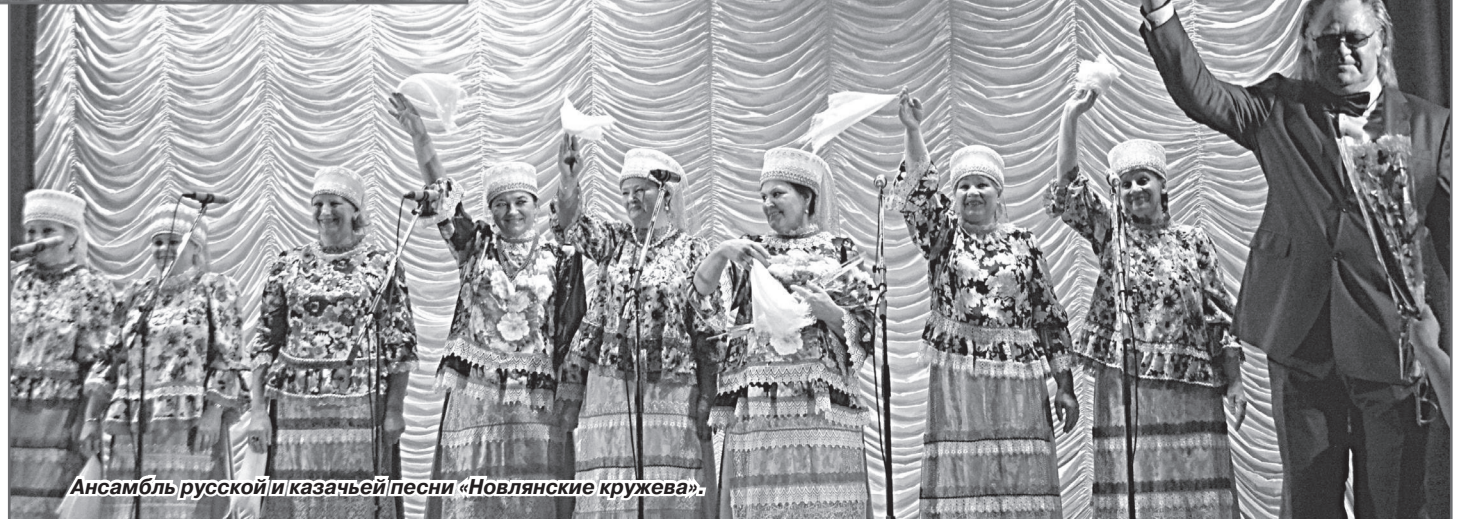
Ансамбль русской и казачьей песни «Новлянские кружева».