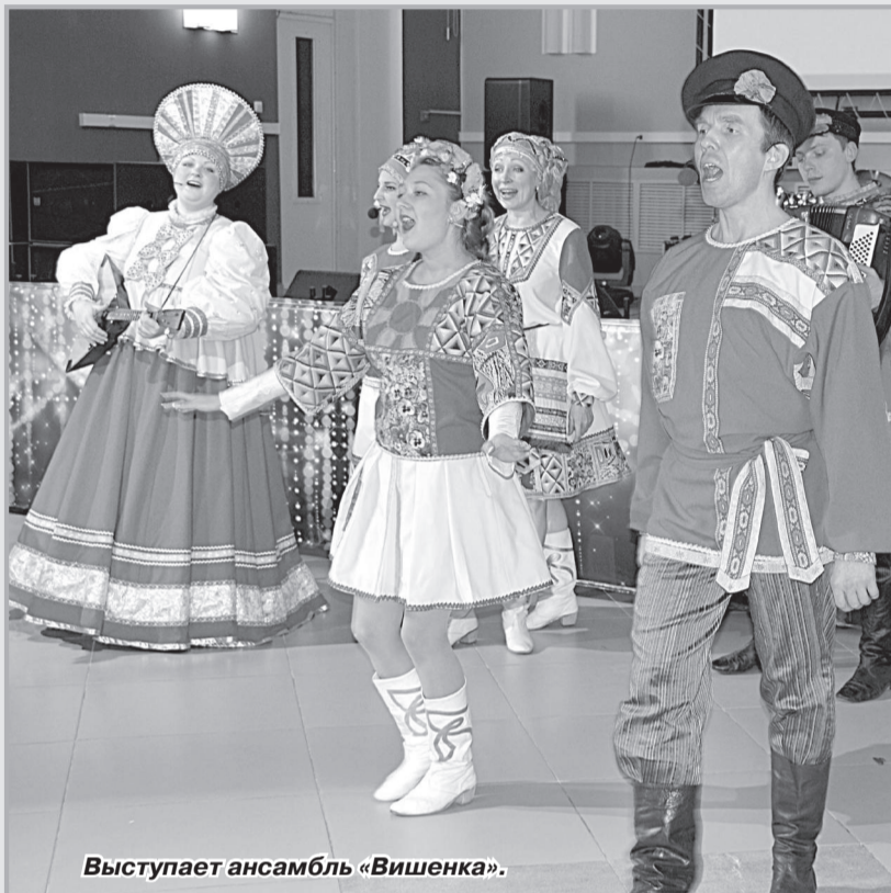
Выступает ансамбль «Вишенка».