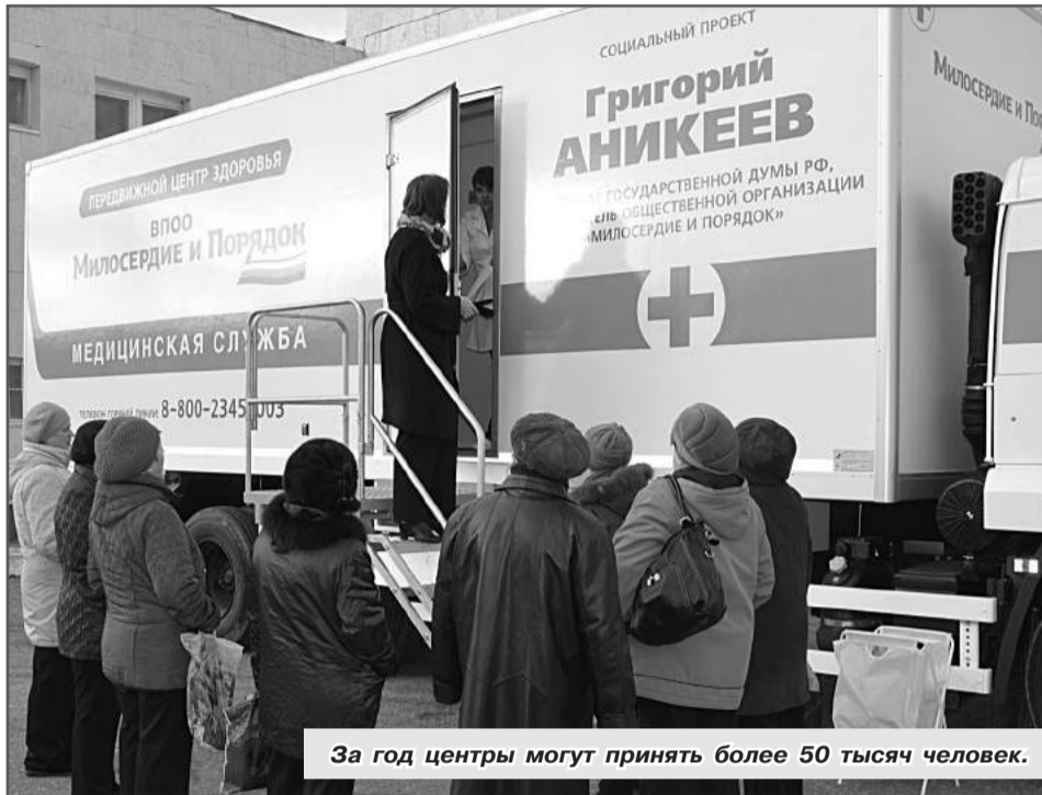
За год центры могут принять более 50 тысяч человек.

«Положительное отношение к проекту наших земляков говорит о том, что мы все делаем правильно».