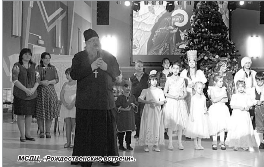
МСДЦ, «Рождественские встречи».

От всей души хочется поблагодарить всех, кто в новогодние дни не отдыхает, а работает и дарит нам праздничное настроение. Очень много положительных отзывов пришло в редакцию газеты от юных и взрослых радужан, посетивших в праздничные дни наши досуговые и спортивные учреждения.