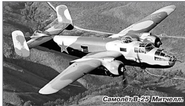
Самолёт В-25 Митчелл.

Дата выбытия: В ночь с 15.06.1944 на 16.06.1944.