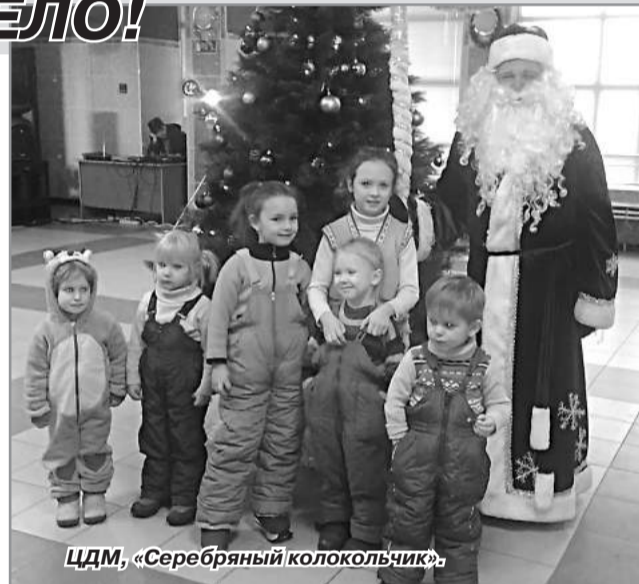
ЦДМ, «Серебряный колокольчик».