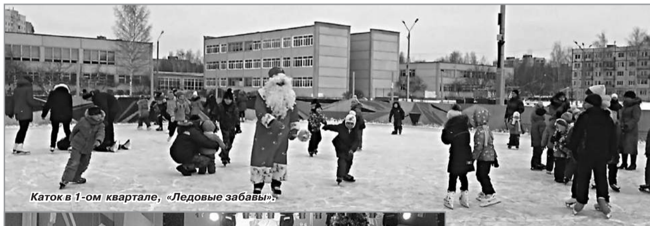
Каток в 1-ом квартале, «Ледовые забавы».

Веселью и традиционным зимним развлечениям во время зимних каникул никакой мороз, конечно, помешать не мог. Радужане активно участвовали во всех мероприятиях, ходили на концерты, новогодние и рождественские представления, спортивные соревнования, катались на коньках, санках.