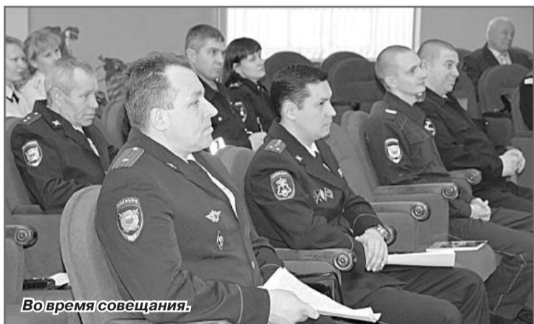
Во время совещания.