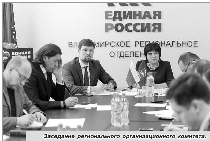
Заседание регионального организационного комитета.

По мнению политологов, на этапе выдвижения главный вопрос заключается в том, примет ли губернатор Светлана Орлова участие в предварительном голосовании. И если да, то когда