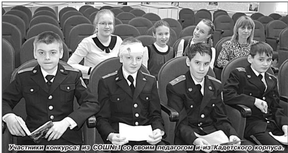
Участники конкурса: из СОШ№1 со своим педагогом и из Кадетского корпуса