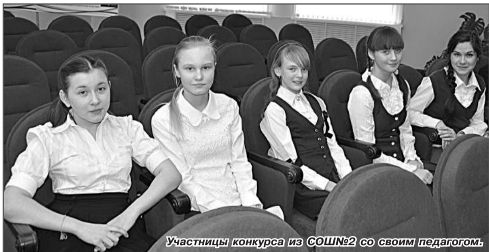
Участницы конкурса из СОШ№2 со своим педагогом.

Рекордное количество заявок - более 100 - поступило в этом году на ежегодный областной конкурс «Герой нашего времени», который состоялся во Владимире, на Добра-сельской, 2г, в рамках долгосрочной программы депутата Госдумы Григория Аникеева «Гордись страной, расти патриотом!».