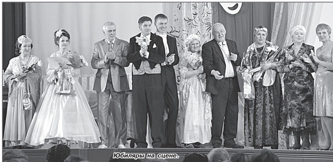
Юбиляры на сцене.

радужан, был спектакль «Миллион за улыбку» по пьесе А. Софронова. С ней артисты впервые вышли на сцену в 1994 году.