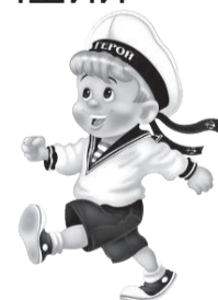
ГРАФИК ПРИЁМА ГРАЖДАН

ПОБЕДИТЕЛЕЙ ЖДУТ ПРИЗЫ. Приглашаем к участию всех желающих.