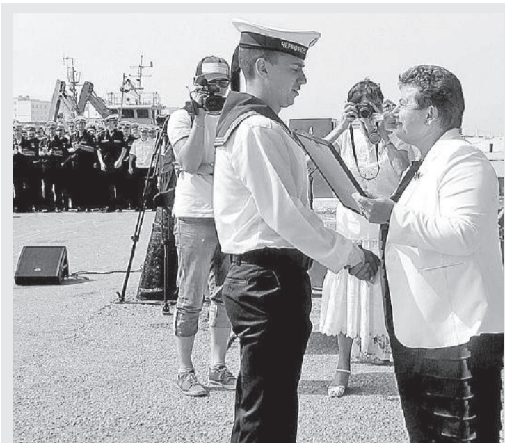
Вручение наград морякам

димирской области, о тех перспективных направлениях, по которым в регионе ведется работа. «Надеюсь, что после службы на флоте - вы вернетесь домой и вольетесь в нашу работу», - обратилась она к землякам.