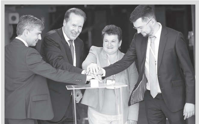
Пуск комбината в Великодворском.

В посёлке Великодворский Гусь-Хрустального района состоялось открытие перерабатывающего комбината, который стал первым во Владимирской области предприятием по добыче и обогащению высококачественных кварцевых песков.