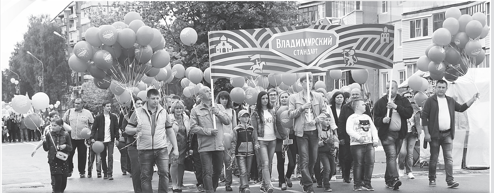
В субботу, 19 мая, в Радужном прошли праздничные мероприятия, посвящённые Дню города.