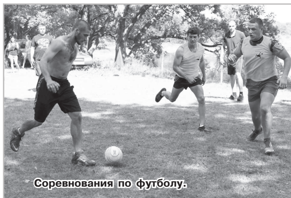
Соревнования по футболу.

В год проведения чемпионата мира по футболу в