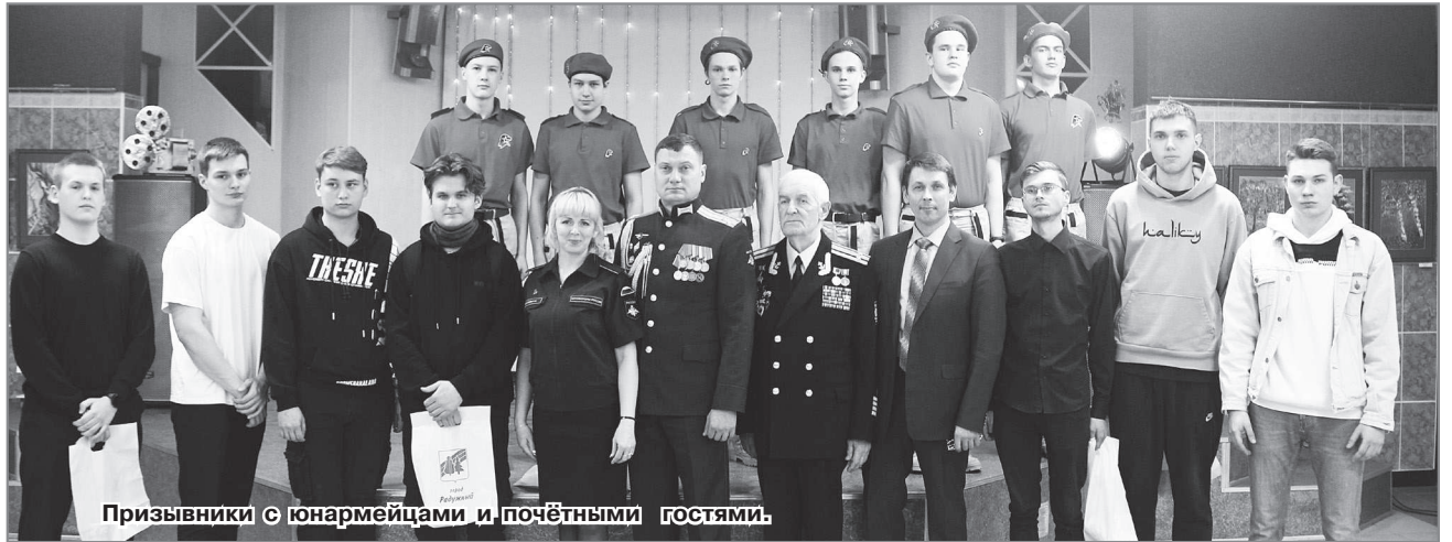
Призывники с юнармейцами и почетными гостями.