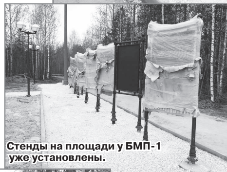
Стенды на площади у БМП-1 уже установлены.