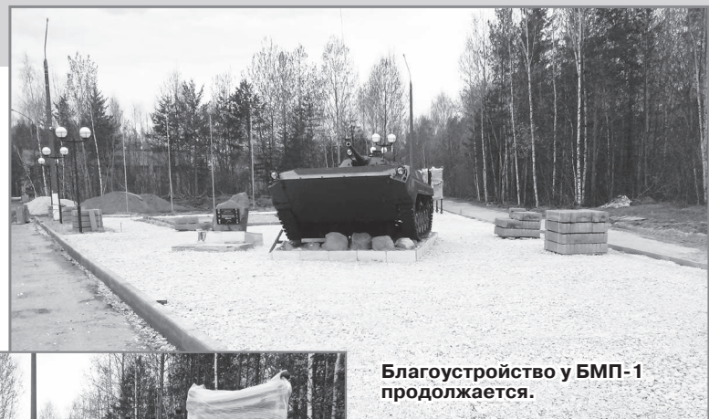
Благоустройство у БМП-1 продолжается.

В конце марта начались работы по благоустройству общественной территории у БМП-1. Заказчиком работ является МКУ «ГКМХ», подрядчик - ООО «Слобода», директор