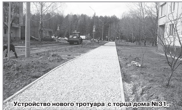
Устройство нового тротуара - с торца дома №31.