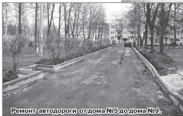
Ремонт автодороги от дома №5 до дома №9.

ООО «Автодорстрой» также выполняет работы по ремонту автодороги от жилого дома №9 до жилого дома №5 в первом квартале. Уже произведено фрезерование старого асфальтового покрытия, заменён бортовой камень. Заказчик работ: МКУ «Дорожник». Сумма контракта составляет порядка 1,5 млн рублей. Срок окончания работ по контракту также 29 июля.