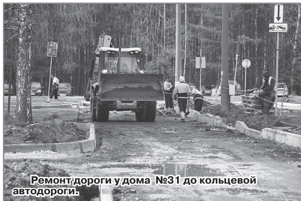
Ремонт дороги у дома №31 до кольцевой автодороги.

Асфальтовое дорожное покрытие между домами №32 и №31 до кольцевой автодороги давно требовало ремонта: в больших выбоинах после дождей образовывались огромные лужи, автомобилистам ездить по этой дороге было не очень удобно. А она довольно востребована не только жителями домов №32 и №31, но и радужанами, которые привозят детей во вторую школу на уроки.