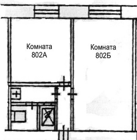
Приложение к постановлению администрации ЗАТО г. Радужный Владимирской области от 10.06.2022 № 745 Квартира № 802 в доме 8 9-го квартала ЗАТО г. Радужный 8 этаж