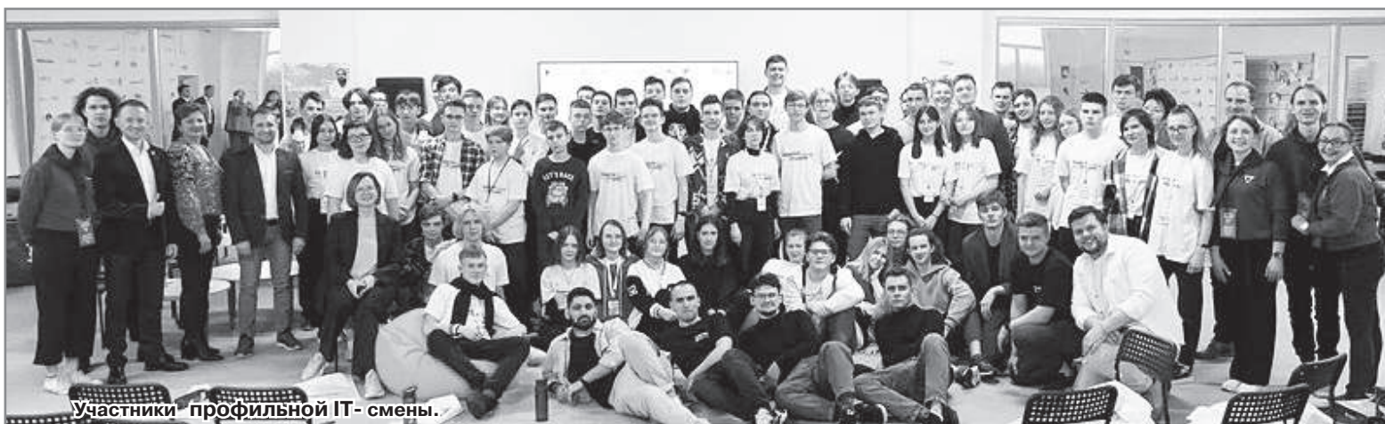
Участники профильной ИТ-смены.

Управление образования, Н. Пугаева. Фото предоставлены авторами.