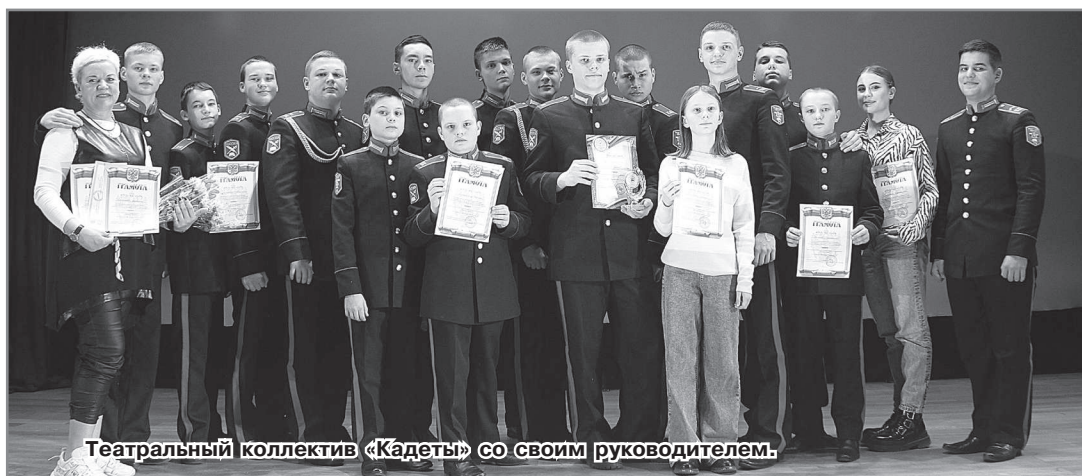
Театральный коллектив «Кадеты» со своим руководителем.