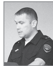
В. СКАРГА.