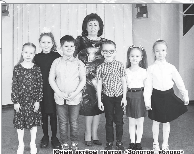
Юные актёры театра «Золотое яблоко» со своим руководителем.