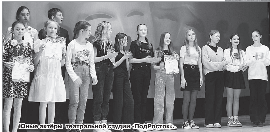
Юные актёры театральной студии «ПодРосток».

рий!» по мотивам басни И.А. Крылова «Ворона и лисица». Спектакль покориł зрителей юмором, необыкновенной сыгранностью всего коллектива, добротой и эмоциональностью каждого актёра.