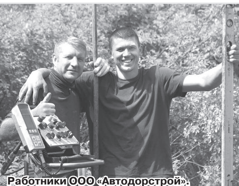
Работники ООО «Автодорстрой».