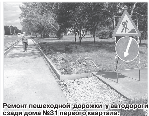
Ремонт пешеходной дорожки у автодороги сады дома №31 первого квартала.