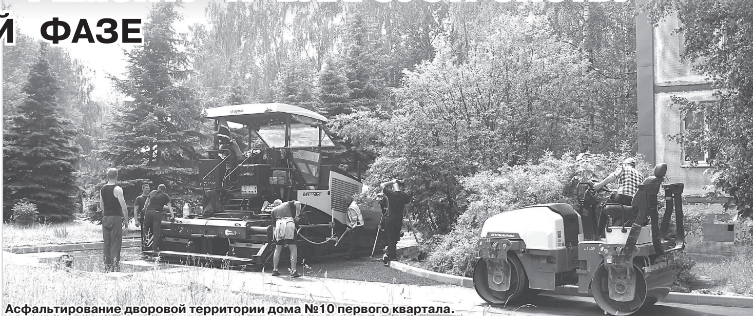
Асфальтирование дворовой территории дома №10 первого квартала.

С мая на территории нашего города начались работы по ремонту автомобильных дорог и пешеходных дорожек. Все работы идут в соответствии с графиком производственных работ, - рассказал он. - Так, на сегодняшний день сделан участок дорожного полотна на 17-й площадке, от офиса «Электон» до здания ГИБДД. Но работы на этом участке полностью ещё не завершены, ещё будет устройство пешеходного перехода. Оставшийся участок дороги до КПП разбит на два этапа ремонта, которые будут реализованы в 2024-2025 г.г.