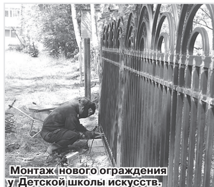
Монтаж нового ограждения у Детской школы искусств.