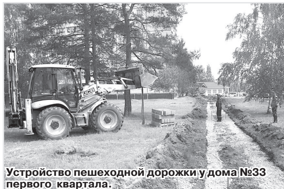
Устройство пешеходной дорожки у дома №33 первого квартала.