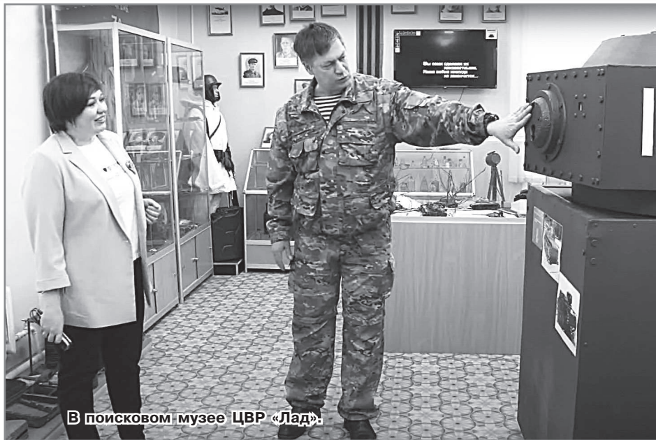
В поисковом музее ЦВР «Лад».