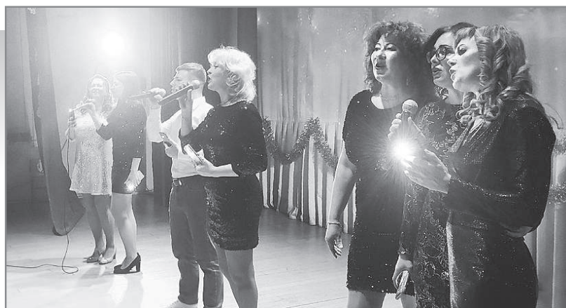
По информации со страниц учреждений культуры в соцсетях.

Сказку переложили на спектакль, пригласили родителей – получилась увлекательная театральная гостиная. Дети вместе с родителями в очередной раз убедились в том, что природу надо любить, беречь и охранять. А «новоиспечённый» Колобок заразил всех добротой, радостью и хорошим настроением!