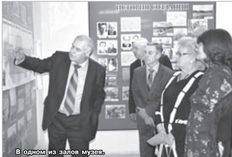
В одном из залов музея.