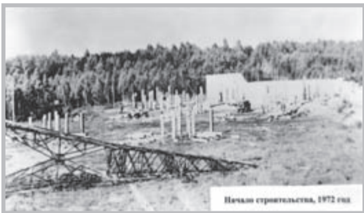
Начало строительства, 1972 год