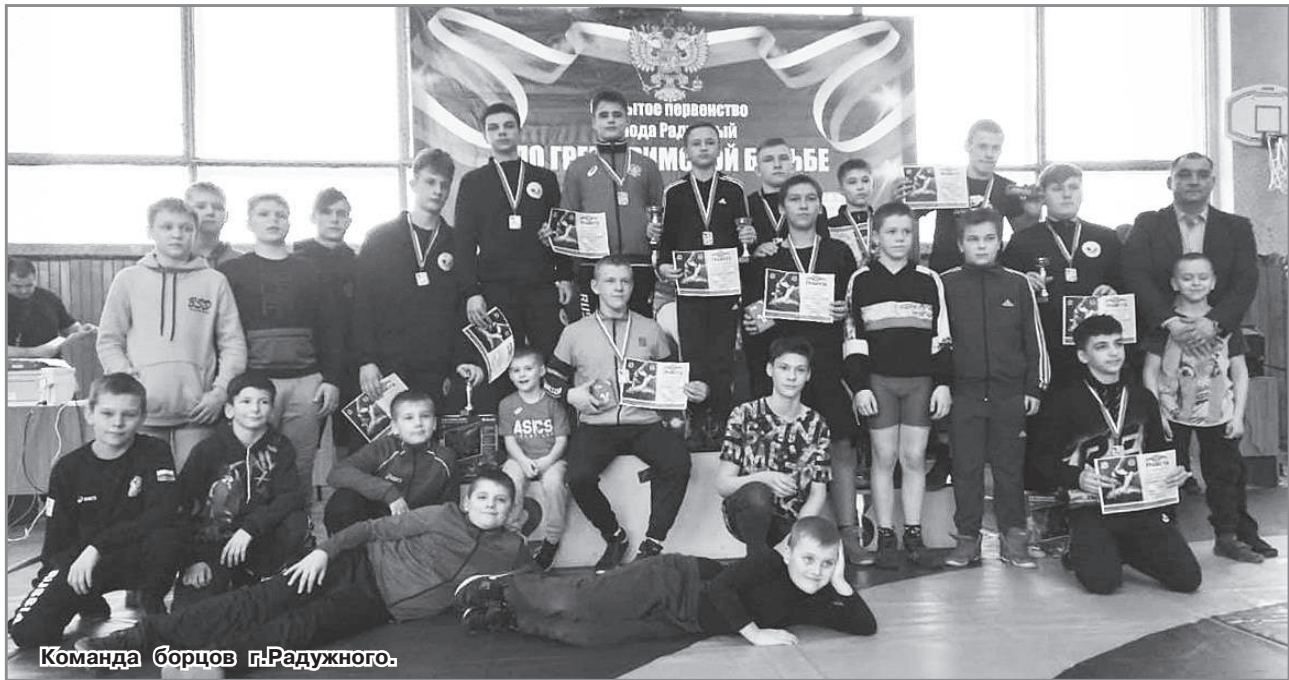
Команда борцов г.Радужного.