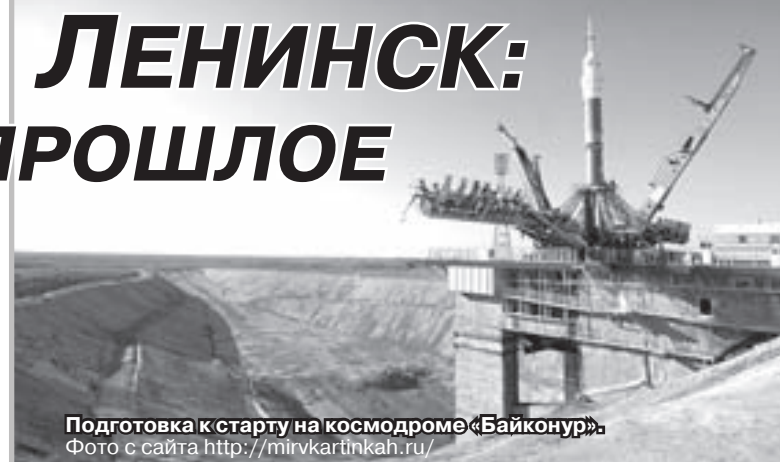
Подготовка к старту на космодроме «Байконур».

12 апреля 1961 года - этот день навсегда вошёл в историю человечества. Весенним утром мощная ракета-носитель вывела на орбиту первый в истории космический корабль «Восток» с первым космонавтом Земли - гражданином Советского Союза Юрием Гагариным на борту. За 1 ч 48 мин. Юрий Гагарин облетел земной шар и благополучно приземлился в окрестностях деревни Смеловки Терновского района Саратовской области.