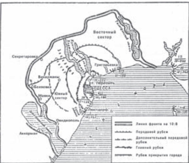
Схема расположения береговой артиллерии одесской ВМБ к 22 июня 1941 года.