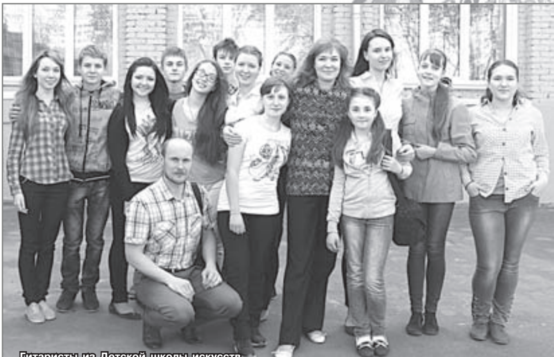
Гитаристы из Детской школы искусств.