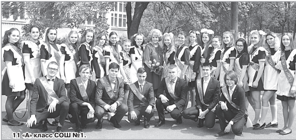
11 «А» класс СОШ №1.

День был солнечный, поэтому перед началом праздничного мероприятия нарядные выпускники фотографировались на па-