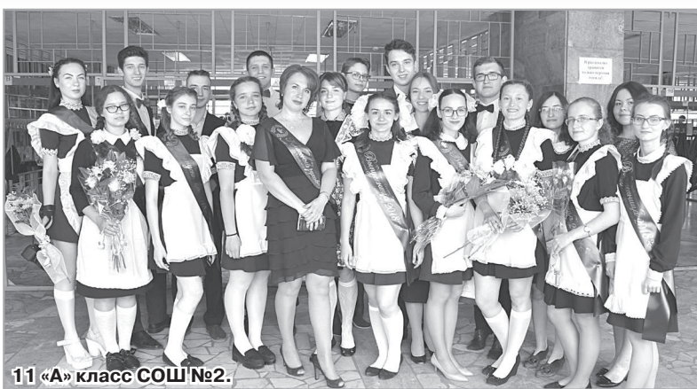
11 «А» класс СОШ №2.