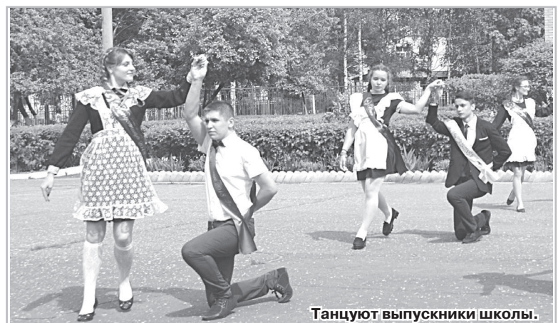
Танцуют выпускники школы.