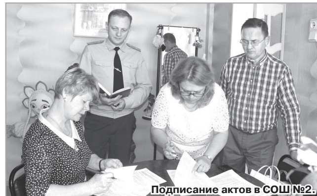
Подписание актов в СОШ №2.

В ходе проверки учреждений члены комиссии прошли по всем помещениям для пребывания детей, побеседовали с педагогами и ответственными за безопасность детей лицами, высказав им свои пожелания и предложения по лучшей