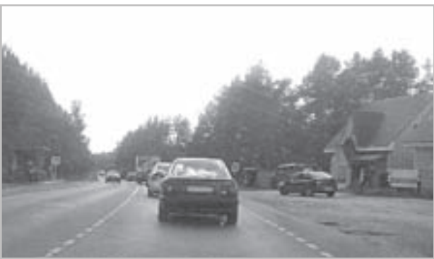
Пробка от остановки «Станция Улыбышево» до ж/д переезда.

В. СКАРГА (по информации МКУ «ГКМХ»). Внизу - фото автора.