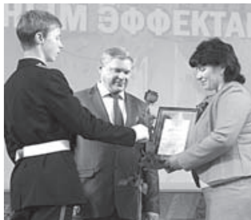
Кольчугинского Меленковского, Муромского, Селивановского и Собинского районов.

Лауреатами конкурса стали педагоги из городов Владимир, Гусь-Хрустальный, Камешково, Ковров, Костерёво, Муром и Радужный, Вязниковского, Киржачского, Ковровского,