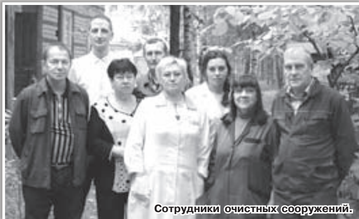
Сотрудники очистных сооружений.