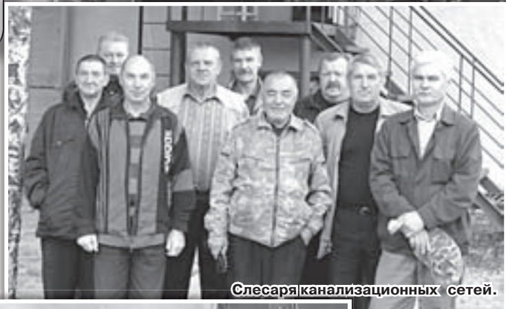
Слесаря канализационных сетей.