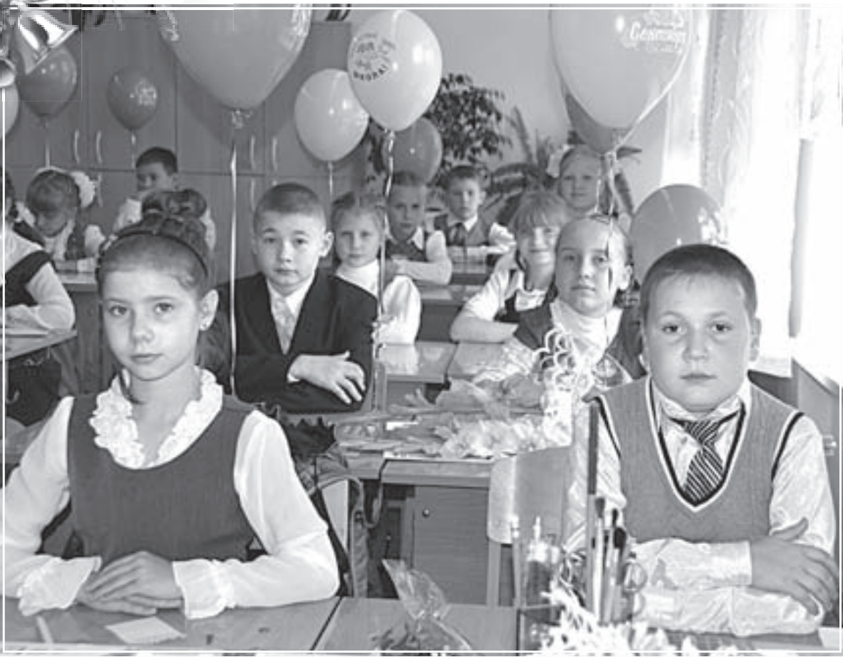
Учащиеся СОШ №1.