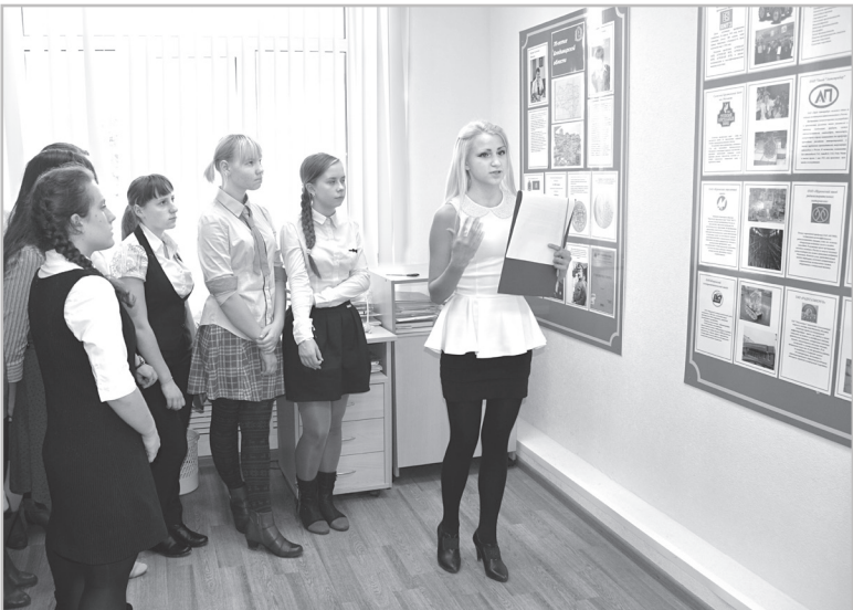
Во вторник, 14 октября в зале сменных экспозиций музея боевой и трудовой славы ЦВР «Лад» открылась экспозиция, посвящённая 70-летию Владимирской области.

Конечно, на трёх стендах экспозиции трудно рассказать о богатейшей истории нашего края. Она знакомит посетителей лишь с малой частью того, что должны знать и чем могут гордиться жители Владимирской области.