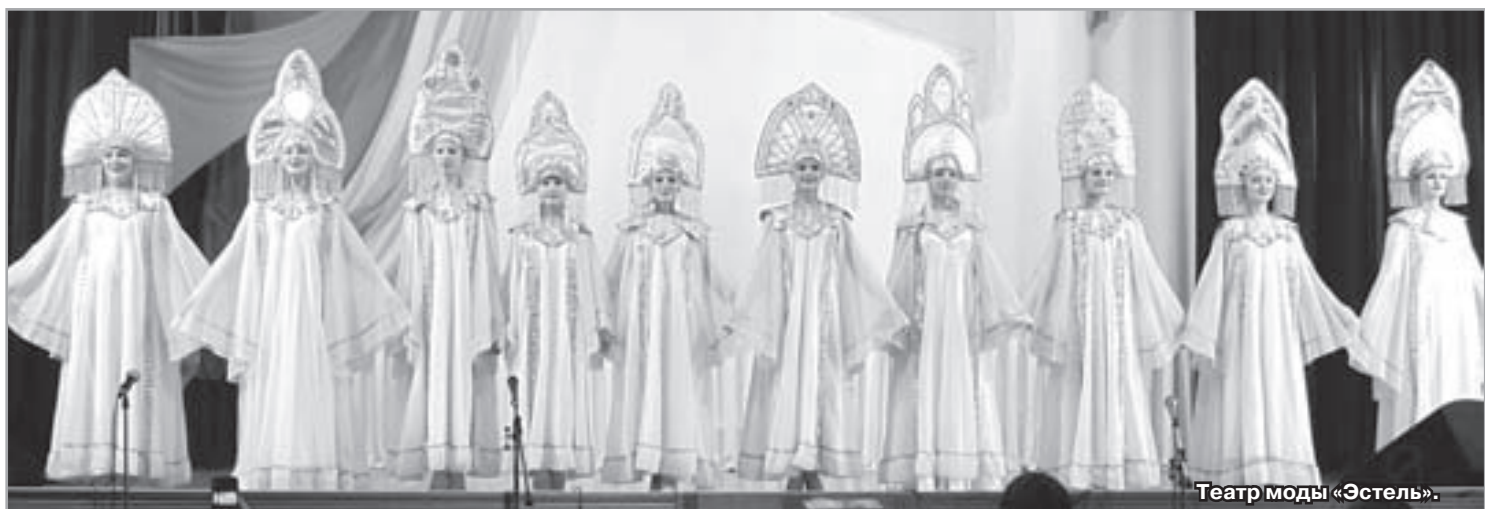
Театр моды «Эстель».