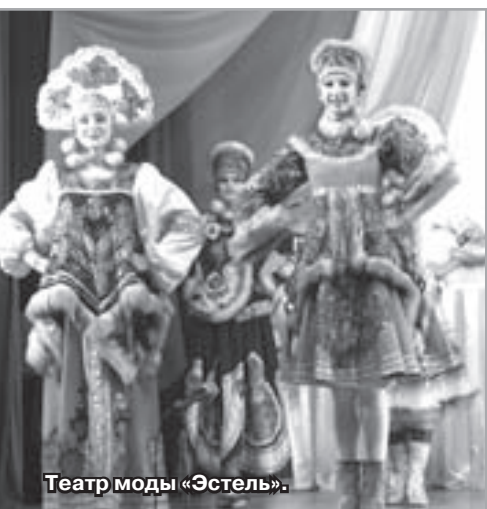
Театр моды «Эстель».