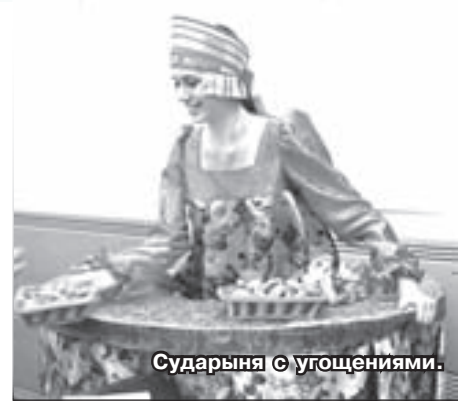
Сударыня с угощениями.

Но самое большое впечатление произвёл кольчугинский театр моды «Эстель». Участники коллектива, одетые в стилизованные наряды минувших веков, то проплывали лебедушками в кипельно-белых сарафанах с высокими кокошниками, то чинно шествовали царь-девицами в кружевных одеяниях, то, укра-