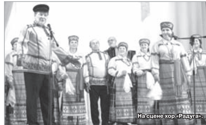
На сцене хор «Радуга».