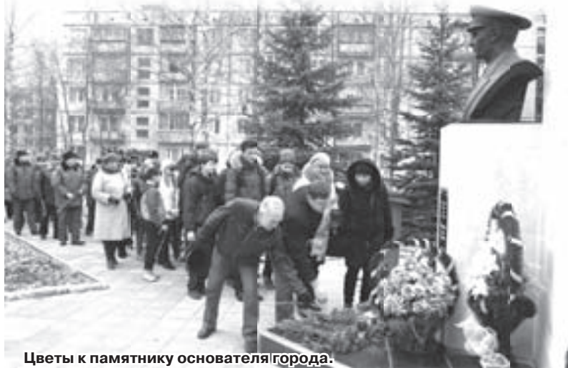
Цветы к памятнику основателя города.