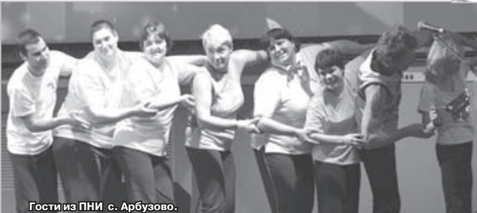
Гости из ПНИ с. Арбузово.