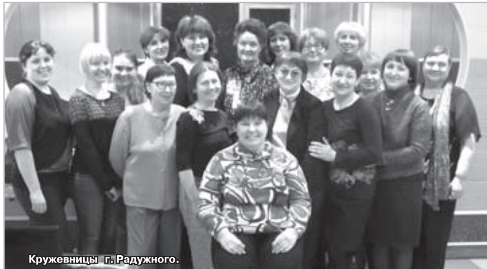
Кружевницы г. Радужного.

Наверное, многим из нас, живущих в 21 веке, сложно представить, что и сегодня, в век бурного развития технологий и потребительского рынка, находятся любители заниматься рукоделием, например, вязать спицами или крючком разнообразные вещи своим родным и близким, и даже плести кружева на коклюшках. Хотя сейчас изделия, созданные вручную, согреты душевным теплом мастериц-рукодельниц, имеющие неповторимую оригинальность, приобретают всё большую актуальность и ценность, и у нас, и за рубежом. И тем более сложно представить, как, благодаря увлечению кружевоплетением, можно путешествовать по миру.