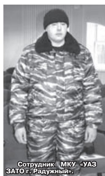
Сотрудник МКУ «УАЗ ЗАТО г. Радужный».

Среди сотрудников МКУ «УАЗ ЗАТО г. Радужный», которые будут осуществлять свою деятельность на КПП, все жители г.Радужного. Со всеми ними