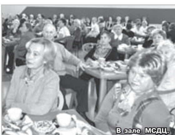
В зале МСДЦ.

— Для нас невероятно важно отметить День инвалида. Ведь далеко не каждый из нас сможет участвовать в общественных мероприятиях для здоровых людей. А здесь мы среди своих, здесь все наравне. И никто никого не стесняется и не