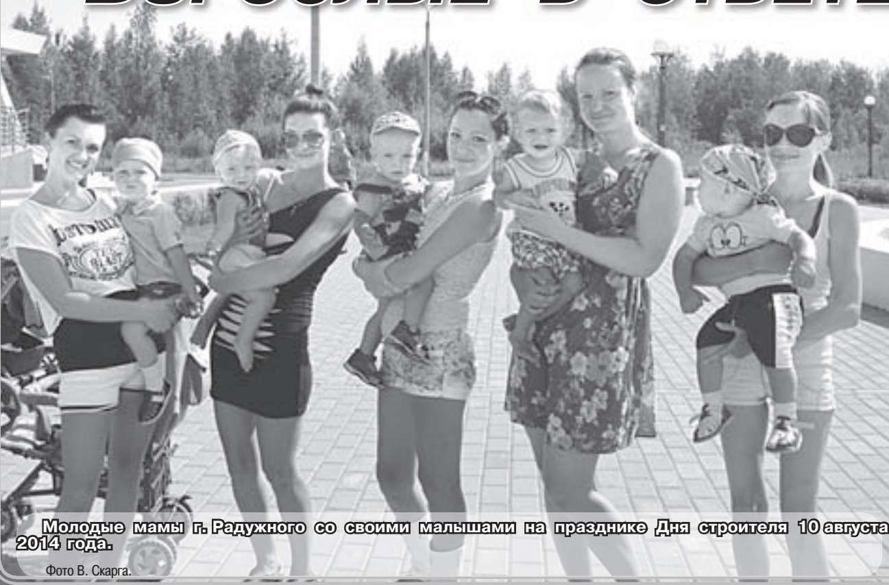
Молодые мамы г. Радужного со своими малышами на празднике Дня строителя 10 августа 2014 года.