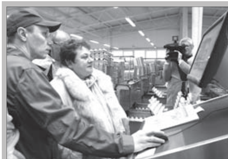
Светлана Орлова посетила производственные площадки объединения «ВладЗерноПродукт».

Объединение «ВладЗерноПродукт», включающее в себя две птицефабрики в Лакинске и Ковровском районе, является одной из крупнейших структур агропромышленного комплекса региона. Общее поголовье птицы составляет около 2 млн. голов, ежесуточно выпускается 1 млн. 200 тыс. штук яиц, годовой объем производства достигает 435 млн. штук яиц. Поголовье кур-несушек и молодняка на Ковровском предприятии составляет