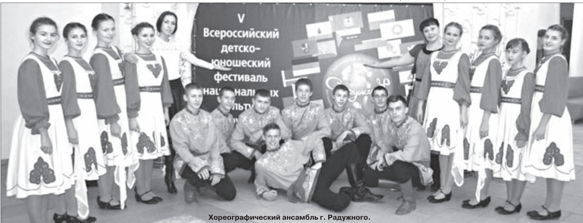
Хореографический ансамбль г. Радужного.