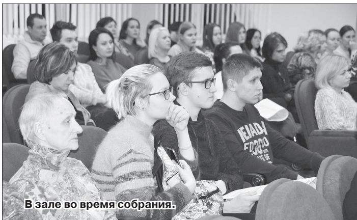
В зале во время собрания.

Для выпускников и их родителей был подготовлен разнообразный раздаточный материал о профессиональных учебных заведениях г. Владимира и области.