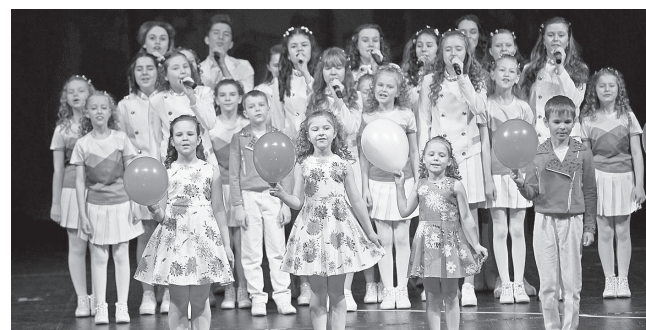
Во время концерта для участников конкурса

Победителей определили по итогам интернет-голосования на сайте любимая-земля-владимирская.рф, в котором было отмечено свыше 130 тысяч посетителей. В результате народ-