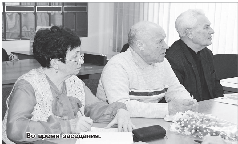
Во время заседания.