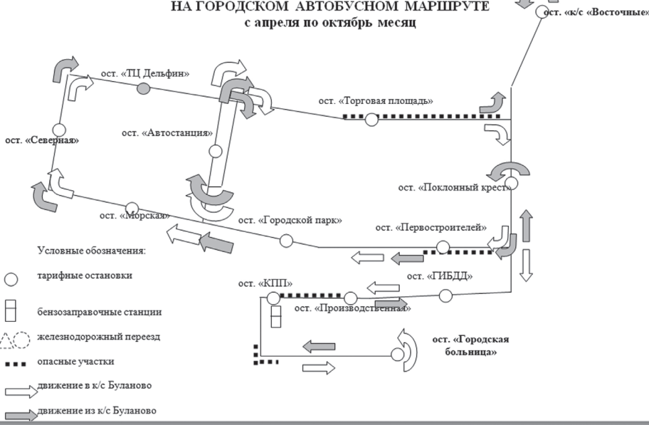
Приложение №2 к муниципальной программе «Развитие пассажирских перевозок на территории ЗАТО г. Радужный Владимирской области.»