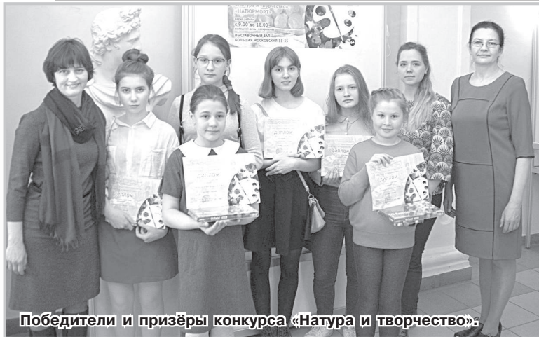
Победители и призёры конкурса «Натура и творчество».