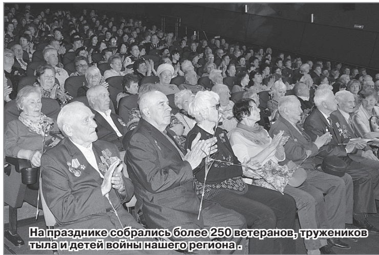
На празднике собрались более 250 ветеранов, тружеников тыла и детей войны нашего региона.