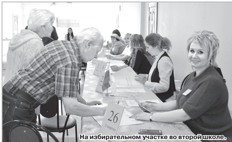
На избирательном участке во второй школе.

Итак, жители области сделали свой выбор, доверив руководство региона Владимиру Владимировичу Сипягину, церемония вступления в должность губернатора запланирована на начало октября.