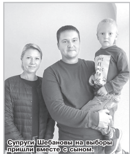
Супруги Шебановы на выборы пришли вместе с сыном.

тели от «Единой России» и С.Ю. Орловой также отметили, что всё проходит без замечаний, очень организованно.