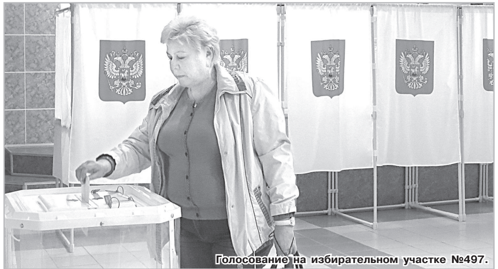
Голосование на избирательном участке №497.

На избирательном участке №497, который располагался в Центре досуга молодёжи, процесс голосования проходил также чётко и отлаженно. Если у избирателей воз-