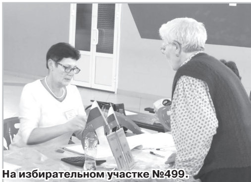
На избирательном участке №499.

Наверное, впервые мы стали свидетелями и участниками протестного голосования. И оно объяснимо. Людям сейчас живётся не очень хорошо, они не против Орловой, они против системы.