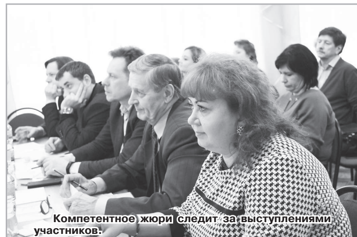
Компетентное жюри следит за выступлениями участников.