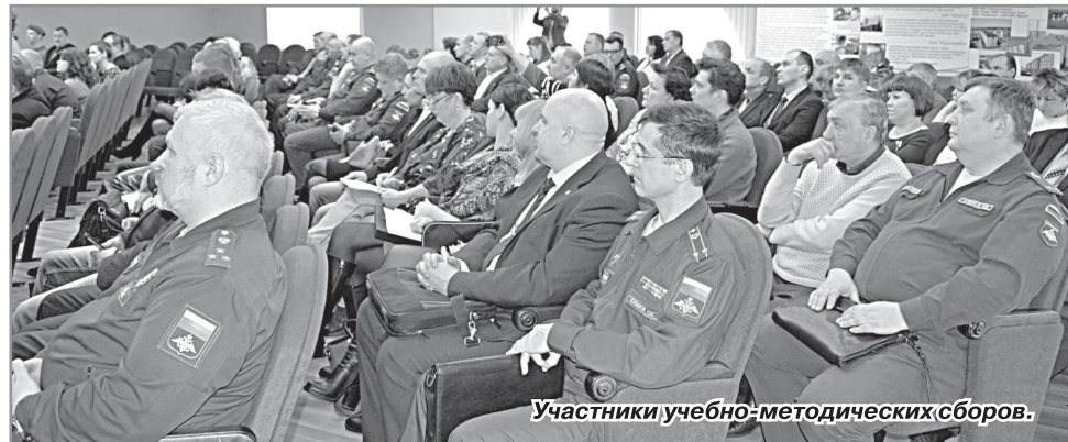
Участники учебно-методических сборов.