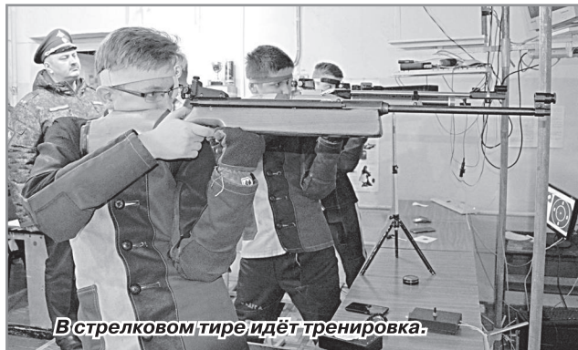
В стрелковом тире идёт тренировка.