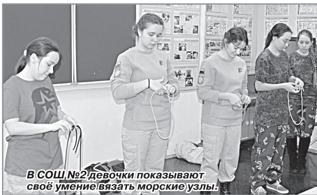
В СОШ №2 девочки показывают своё умение вязать морские узлы.