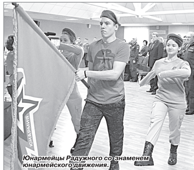
Юнармейцы Радужного со знаменем юнармейского движения.

Затем о деятельности поисковиков нашего города и работе, которая ведётся в городе по патриотическому воспитанию молодёжи, рассказал руководитель городского зонального центра, соз-