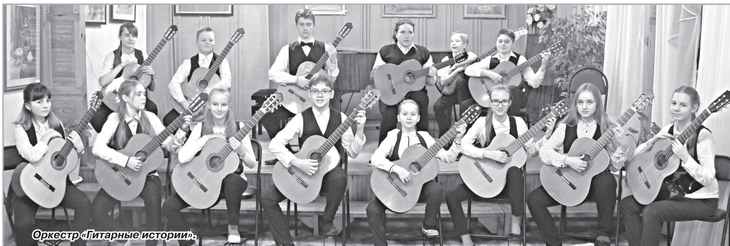
Оркестр «Гитарные истории».