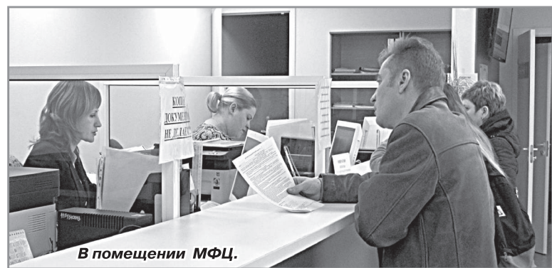
В помещении МФЦ.

В целом радужане довольны работой МФЦ и относятся к его работе положительно, ведь теперь, чтобы получить какую-либо справку, оформить документы на квартиру или гараж, получить загранпаспорт и т.п., не нужно куда-то ехать, а получить готовые документы можно