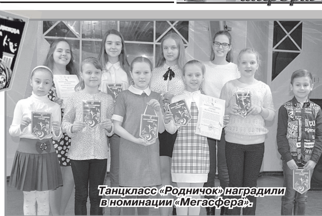
Танцкласс «Родничок» наградили в номинации «Мегасфера».