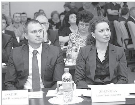
В заседании коллегии приняли участие эксперты федерального уровня.

Не хватает среднего медперсонала. Рассматриваются вопросы расширения учебных площадей медколледжей во Владимире, Гусь-Хрустальном, Юрьеве-Польском. Идёт работа по созданию медкафедр в ВлГУ.