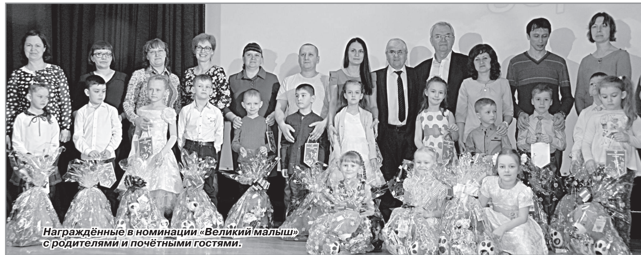
Награждённые в номинации «Великий малыш» с родителями и почётными гостями.

ластного театрального фестиваля «Шоколад».