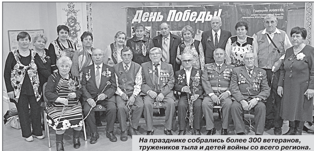
На празднике собрались более 300 ветеранов, тружеников тыла и детей войны со всего региона.