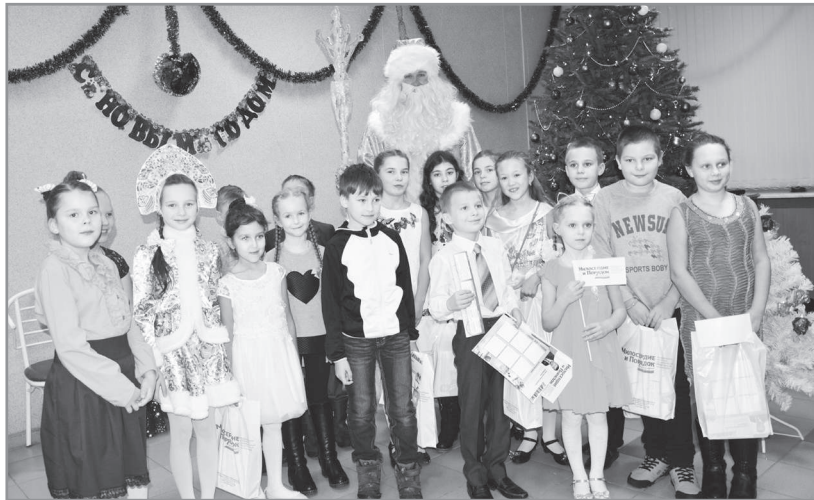
В этом году в новогодних ёлках примут участие более 2000 детей региона.

Во Владимирской области в рамках программы депутата Госдумы Григория Викторовича Анিকেева по поддержке детей и молодёжи проходят новогодние ёлки. В праздничных мероприятиях примут участие более двух тысяч ребятишек.