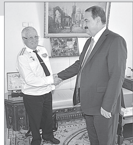
Сирийской Арабской Республикой и народом Российской Федерации.