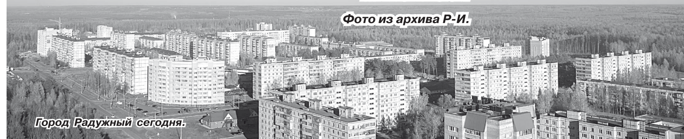
Город Радужный сегодня.