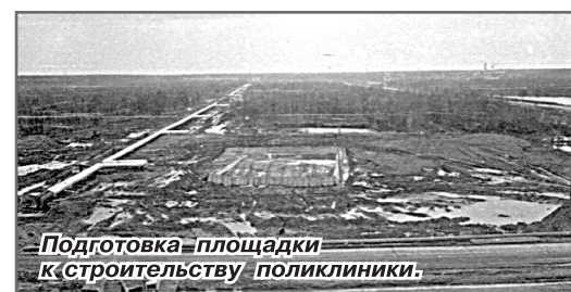
Подготовка площадки к строительству поликлиники.