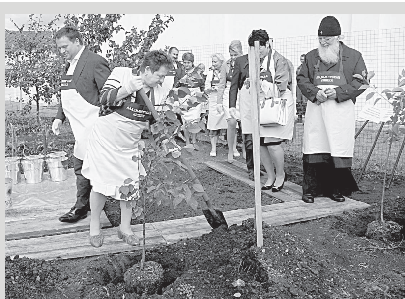
Во время закладки в монастыре владимирской вишнёвой аллеи.

Делегации Владимирской области побывали в Крыму и в Новгороде. Одна из основных задач, которая стояла перед посланцами нашего региона, – наладить новые экономические связи, расширить рынки продаж наших товаров новым российским партнёрам.