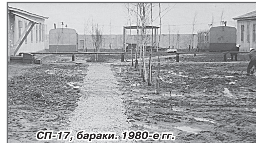
СП-17, бараки. 1980-е гг.

Всё, что было построено, нужно было сохранить и приумножить. В нашем городе это было сделано благодаря грамотному руководству и лично С.А. Найдучову. Если вспомнить недалёкое прошлое, то всплывают в памяти небольшие города России с таким же населением и такими же