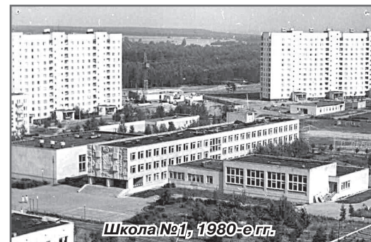
Школа №1, 1980-е гг.

возможностями, но с другими руководителями, которые в буквальном смысле перестали существовать или пришли в полное запустение. А наш город пережил смутные времена безденежья, нехватки топлива и других ресурсов, и не только выстоял, но и продолжил развиваться и строиться.