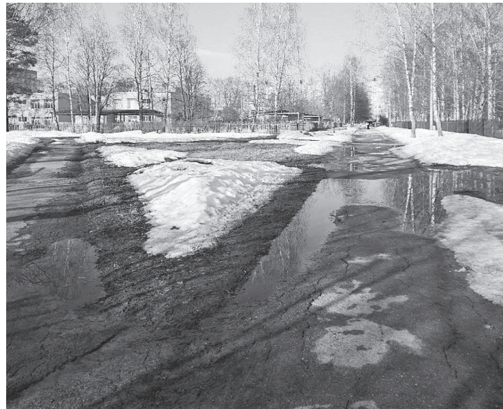
Участок дорог в районе ЦВР «Лад»- СОШ №2-ДОУ №3.

- ремонт входной группы на 1-м этаже административного здания со стороны входа в социальные учреждения, такие как Социальный фонд России, отдел социальной защиты населения по ЗАТО г. Радужный;