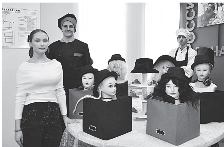
Студенты ВТК со своими работами.

Материальная база колледжа оснащена 28-ю современными специализированными мастерскими. В колледже функционируют 3 учебно-производственных комплекса, где студенты одновременно с профессией и специальностью могут получать и свой первый профессиональный опыт – совмещают учёбу и работу. Это бьюти-каворкинг, студенческая арт-студия и швейная мастерская и центр компетенций сварочных технологий.