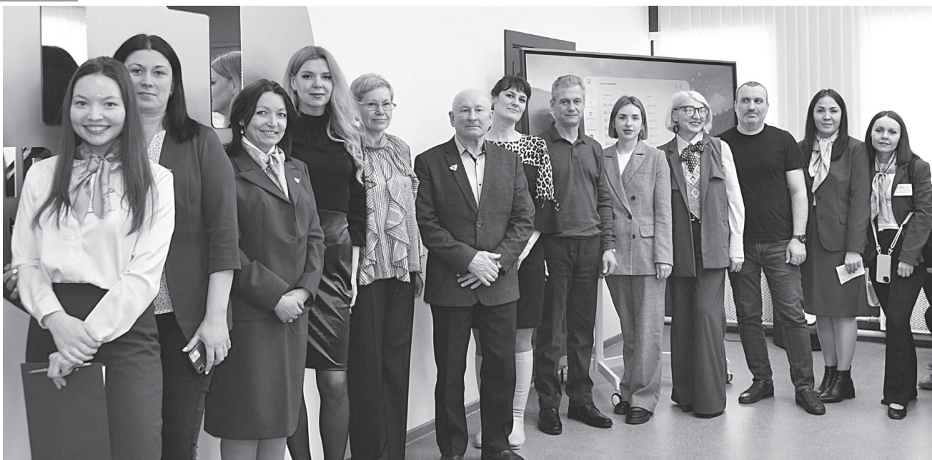
Гости и организаторы «Единого дня выпускника».