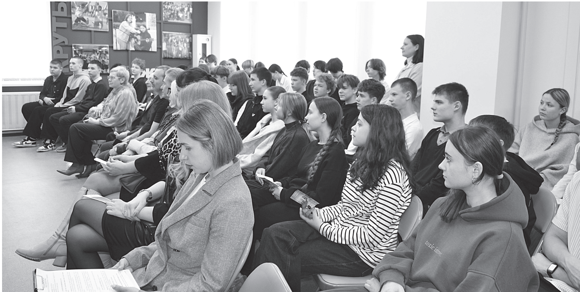
Участники мероприятия «Единый день выпускника».