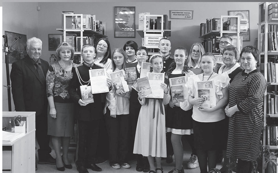
Члены жюри, педагоги и участники конкурса «Живая классика».