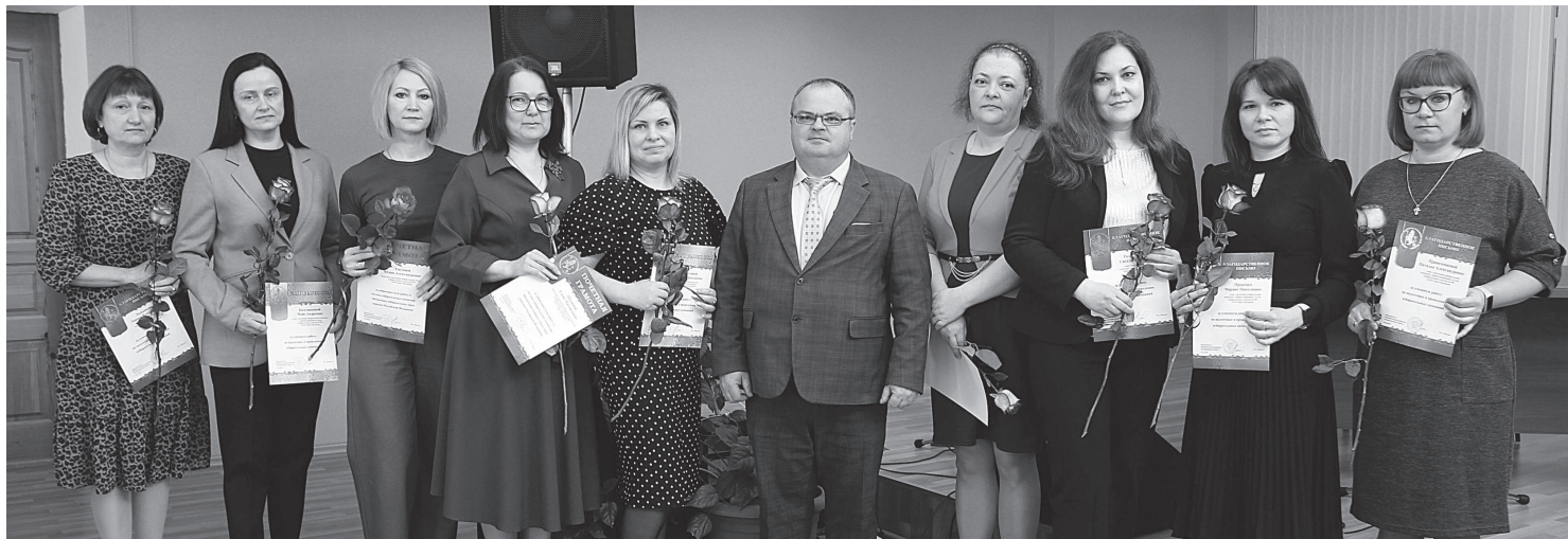
За вклад в подготовку и проведение избирательных кампаний награды получили члены участковых избирательных комиссий нашего города и ТИК ЗАТО г. Радужный.